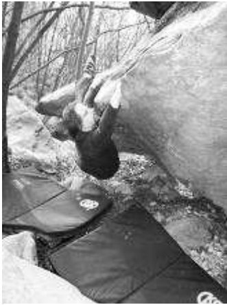
ULTIMO SPARO 6b

Il settore "il Condominio" mi piace particolarmente, è isolato, c'è un'ambiente selvaggio, assoluto e riparato dai venti, caratteristiche che permettono di arrampicare in maglietta (o senza, vedi photo-gallery) anche nel mese di dicembre. Proprio per queste qualità vorrei chiedere a tutti voi di fare attenzione a non sporcare (sigarette, nastro ecc...) e in particolar modo di evitare gli schiamazzi, in questa zona ho avuto il piacere d'incontrare una bellissima volpe, rispettiamo il su o territorio!