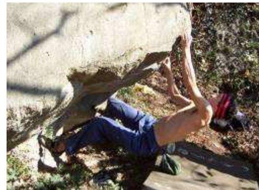
IL PARTO 6c