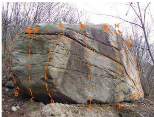
IL GURU (N°3)

Accesso: Dal parcheggio sterrato oltrepassare la stanga e seguire il torrente verso monte, in pochi minuti si giunge ad un paio di massi dall'aspetto poco invitante ma con un bellissimo traverso ("LAMIA NUOVA FIDANZATA" 6b). Proseguire oltre, svoltare a sinistra attraversando il torrente e seguire il sentiero fino ad incontrare la mulattiera che sale verso S. Pietro. Seguite la mulattiera fino al bivio con cartelli e prendete a destra in discesa verso il torrente (segnavia n°8). Nel letto del torrente, a monte e a valle del guado, c'è un altro settore boulder ("TRAPPOLE DI LUCE") ma sconsigliabile nei periodi invernali. Attraversare il torrente e dopo pochi metri ignorare il sentiero che sale verso il C.no Birone prendendo una traccia che devia a destra risalendo un valloncetto, in breve si arriva ai primi massi (10/15 minuti ca.).