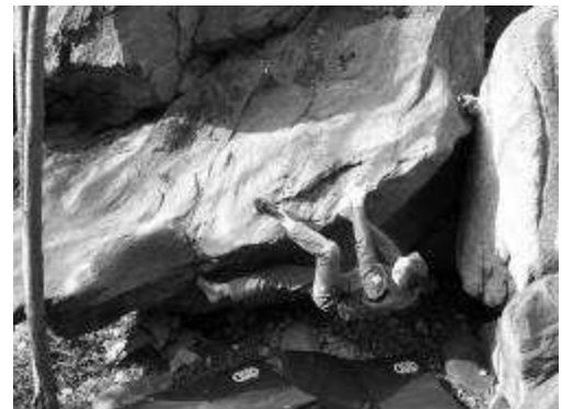
ULTIMO SPARO 6b