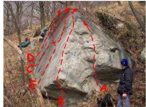
IL LATO OSCURO N°2