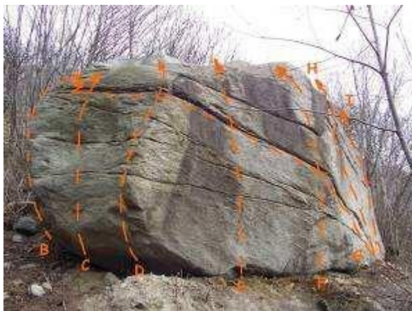
IL GURU (N.3)

Accesso: Dal parcheggio sterrato oltrepassare la stanga e seguire il torrente verso monte, in pochi minuti si giunge ad un paio di massi dall'aspetto poco invitante ma con un bellissimo traverso ("LAMIA NUOVA FIDANZATA" 6B). Proseguire oltre, svoltare a sinistra attraversando il torrente e seguire il sentiero fino ad incontrare la mulattiera che sale verso S. Pietro. Seguire la mulattiera fino al bivio con cartelli e prendete a destra in discesa verso il torrente (segnavia n°8). Nel letto del torrente, a monte e a valle del guado, c'è un altro settore boulder ("TRAPPOLE DI LUCE") ma sconsigliabile nei periodi invernali. Attraversare il torrente e dopo pochi metri ignorare il sentiero che sale verso il C.no Birone prendendo una traccia che devia a destra risalendo un valloncetto, in breve si arriva ai primi massi (10/15 minuti ca.).