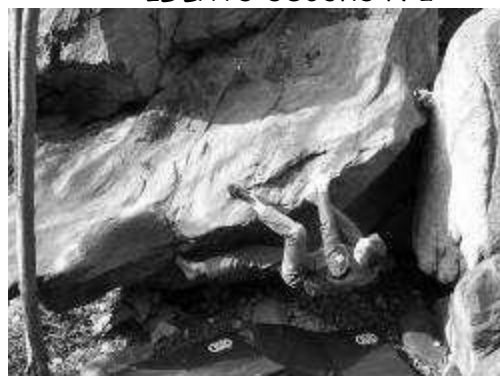
ULTIMO SPARO 6B