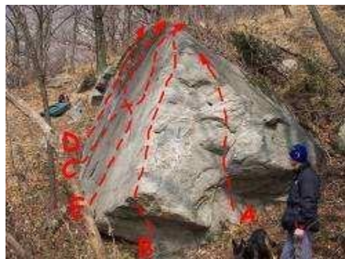
IL LATO OSCURO N°2