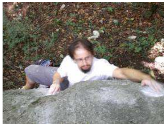
Les Masso-quistes 6a+

Dal parcheggio sterrato seguite il torrente per venti metri e prendete un sentiero che lo attraversa tramite un ponticello e dopo pochi metri svoltate a destra , fiancheggiando un muro a secco si arriva alla cascina Oro. Prendere la mulattiera che porta a S. Pietro (cartelli), una volta arrivati al complesso monastico (25min.ca) seguire la mura di cinta fino al bivio, a sinistra per il "Solarium"(10.min) a destra per "l'Eremo"passando per un cancelletto e successivamente dietro la chiesa dove si prende un sentiero che scende verso il torrente (sentiero segnato n°7). Dall'alto si può già vedere il "RE"(masso n°5)e nei pressi di due pilastri di cemento si può "tagliare" un po' di strada. Proseguendo il sentiero fino a giungere al guado ci si può dirigere verso la cascata dove c'è la "PRUA"(masso n°2)e a valle del guado tutto il resto del settore.(35 min.ca.)