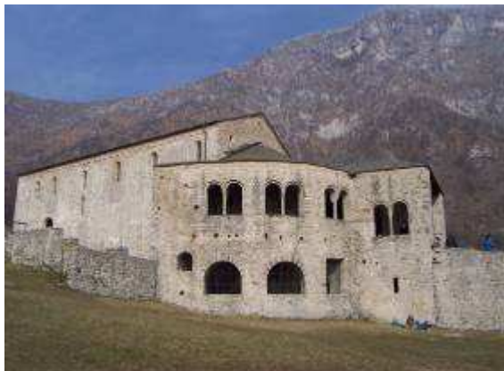
S. PIETRO AL MONTE

Il settore "Eremo" è stato il primo ad essere esplorato in chiave boulder, nell'ormai lontano autunno del 2002, dai ragazzi di freaklimbing.net . Anche se è il settore più lontano merita di essere visitato ed eventualmente si può unire anche un'arrampicata al settore "Solarium" che dista solo 10min. di cammino in piano dalla chiesa di S.Pietro al Monte(vedi topos). Consiglio vivamente a tutti una breve visita al complesso monastico di S.Pietro, un gioiello di architettura e arte romanica risalente al XI sec.D.C. , un po' di cultura non ha mai ucciso nessuno! (qui sotto una breve descrizione) Questo settore è molto adatto nelle mezze stagioni , infatti è costantemente in ombra e si riesce ad arrampicare anche fino a giugno, nelle giornate più calde però tende essere un po' troppo afoso a causa del bosco fitto. Generalmente il ruscello rimane molto