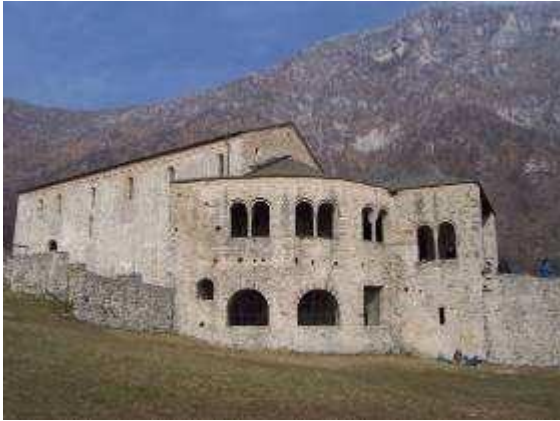
SAN PIETRO AL MONTE

Il settore "Eremo" è stato il primo ad essere esplorato in chiave boulder, nell'ormai lontano autunno del 2002, dai ragazzi di freaklimbing.net. Anche se è il settore più lontano merita di essere visitato ed eventualmente si può unire anche un'arrampicata al settore "Solarium" che dista solo 10min. di cammino in piano dalla chiesa di S.Pietro al Monte(vedi topos). Consiglio vivamente a tutti una breve visita al complesso monastico di S.Pietro, un gioiello di architettura e arte romanica risalente al XI sec.D.C. , un po' di cultura non ha mai ucciso nessuno! (qui sotto una breve descrizione) Questo settore è molto adatto nelle mezze stagioni, infatti è costantemente in ombra e si riesce ad arrampicare anche fino a giugno, nelle giornate più calde però tende essere un po' troppo afoso