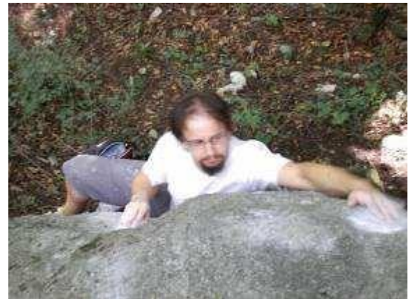
LES MASSO-QUISTES 6A+