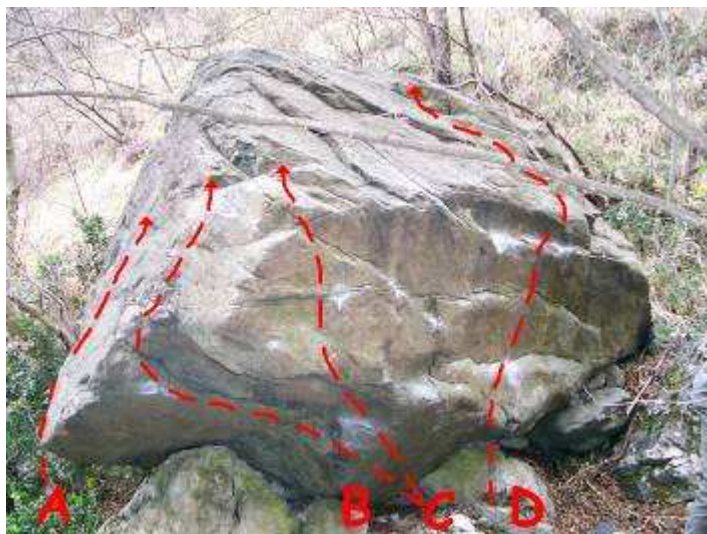
MANICI DI SCOPA E POMI D'OTTONE

Accesso: Questo settore si trova un po' in disparte rispetto a tutto il resto di CivateBloc e per accedervi bisogna parcheggiare diversamente. Passati davanti alla Trattoria "Da Edo", dopo 200 metri si arriva alla strada sterrata del parcheggio per S.Pietro, ignoratela e proseguite la strada asfaltata che svolta a destra in salita, superate alcune case la strada scende ripidamente a destra (sbarra sempre aperta). Si trova un piccolo spazio per parcheggiare a metà della discesa (max 3 auto) oppure in fondo alla strada esiste uno spazio più grande. Una volta lasciata la macchina bisogna tornare indietro fino alla stanga e prendere un'evidente mulattiera che sale di fronte alla strada. In breve diventa sentiero (sentiero 8B) e s'immette nel letto di un ruscello in secca, si passa di fianco ad una recinzione e s'incontrano diverse deviazioni, svoltare a sinistra (freccia rossa semi-cancellata su una roccia) e in breve si arriva ai primi massi. 10/15 min.